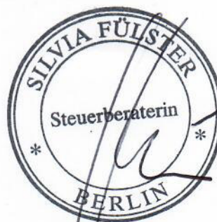
Silvia Fülster Steuerberaterin vereidigte Buchprüferin