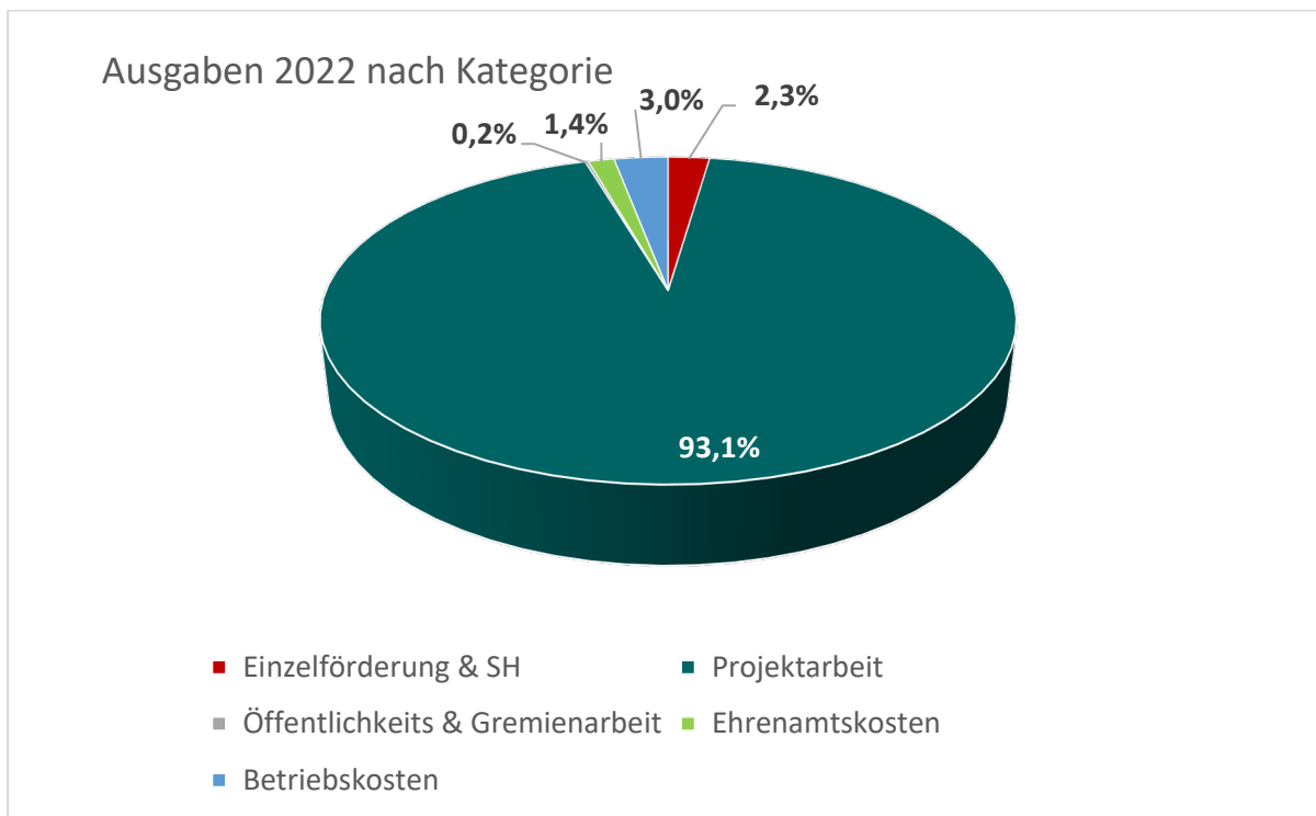
Abb. 1 Verteilung der Ausgaben auf die Kategorien

Im Jahr 2022 hat die Stiftung taubblind leben insgesamt 171.317 € ausgeschüttet. Die Ausgaben der Stiftung verteilen sich wie in Abbildung 1 und Tabelle 1 gezeigt.