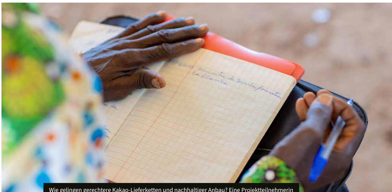
Wie gelingen gerechtere Kakao-Lieferketten und nachhaltiger Anbau? Eine Projektteilnehmerin in Côte d'Ivoire macht sich Notizen.

Unser aktuell größtes Projekt (im Kakaobereich in Côte d'Ivoire), welche von der EU finanziert ist, läuft 2026 aus. Hier gilt es nun bereits im Jahr 2025 eine Anschlussfinanzierung zu akquirieren, damit die gute Arbeit weitergeführt werden kann.