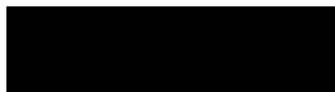
Milchindustrie-Verband e.V. (MIV)