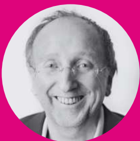
Wilfried Schulz Generalintendant des Düsseldorfer Schauspielhauses