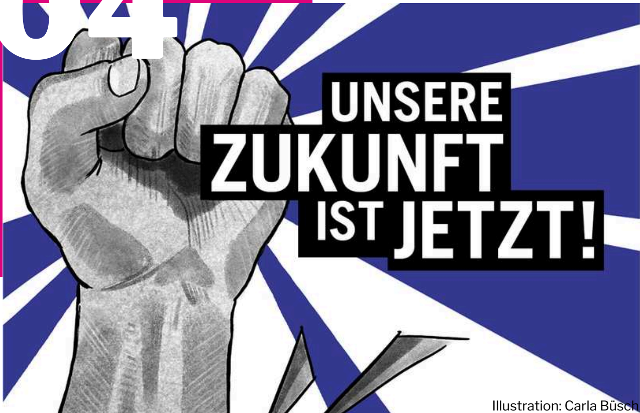
Illustration: Carla Büsch