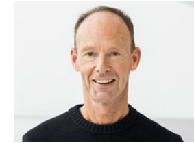
Thomas Rabe Executive Director der RTL Group, CEO und Vorstandsvorsitzender der Bertelsmann Management SE