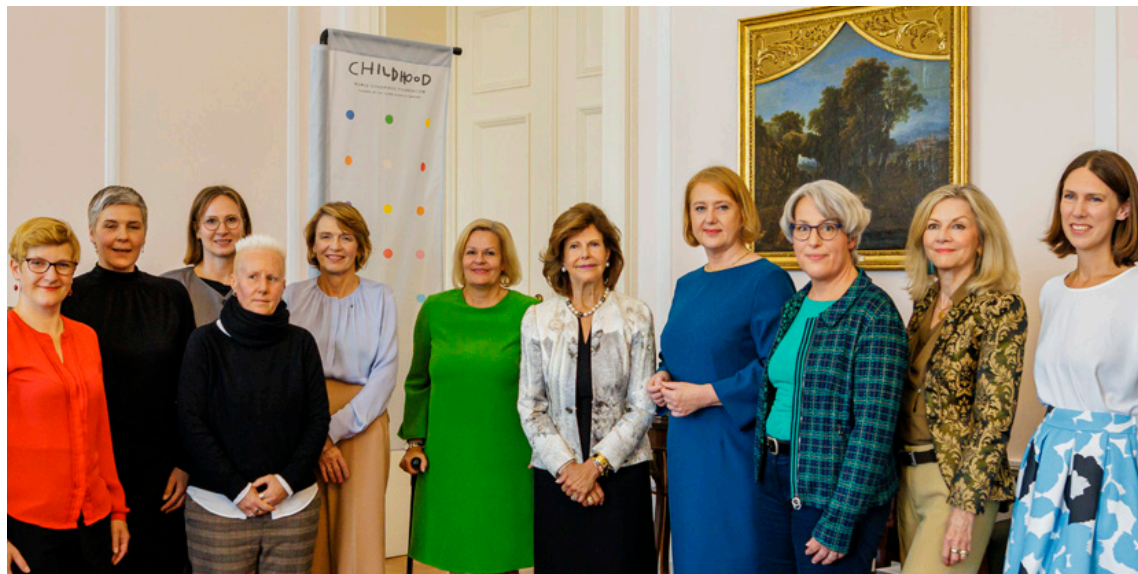
Starke Stimmen für den Kinderschutz vereint beim Round-Table im Schloss Bellevue in Berlin