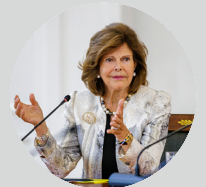
Ihre Majestät Königin Silvia von Schweden

„Ich habe es mir zur Aufgabe gemacht, mit der World Childhood Foundation immer wieder den Fokus auf das oft tabuisierte Thema der sexualisierten Gewalt gegen Kinder zu lenken. Die Stiftung sieht ihren Auftrag darin, als Pionierin Wissen zu verbreiten, Diskurse anzustoßen und zukunftsweisende Initiativen wie das Childhood-Haus Konzept zu fördern. Oft habe ich betont, dass ich mir bei der Gründung der World Childhood Foundation vor 25 Jahren gewünscht habe, der Tag möge kommen, an dem eine solche Stiftung nicht mehr nötig ist. Solange wir diesen Punkt noch nicht erreicht haben, werden wir jeden Tag weiter daran arbeiten, Gewalt und insbesondere sexualisierte Gewalt an Kindern und Jugendlichen zu verhindern.“