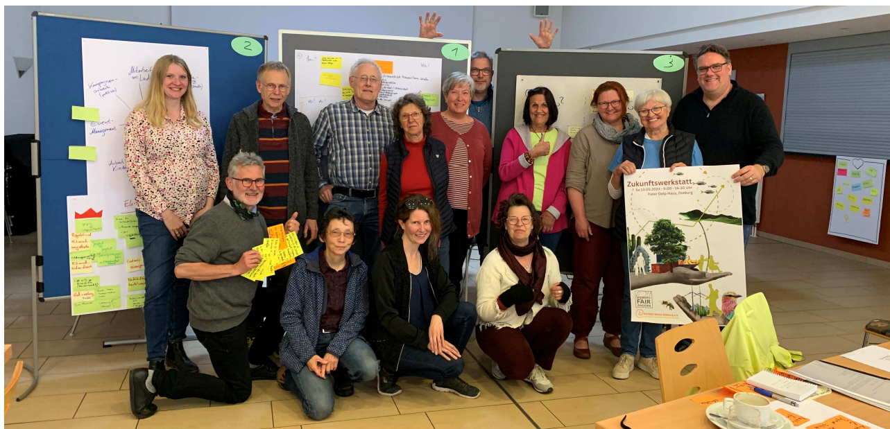
Zukunftswerkstatt am 13. Mai 2023 im PDH

Interne Fortbildung: Ein wichtiger Meilenstein ist aber auch die Digitalisierung der Vereinsarbeit, das Vereinfachen von Prozessen und die Bereitstellung von Daten und Dokumenten. Deshalb gab es im November eine erste Schulung zum Thema „MS TEAMS“ – der Vorstand möchte diese Plattform zukünftig für eine vereinfachte Zusammenarbeit nutzen.