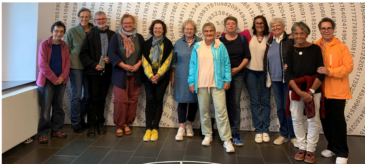
Mitarbeiter*innen Ausflug ins Mathematikum, Gießen