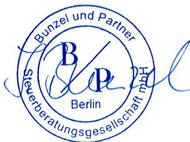
Bunzel und Partner Steuerberatungsgesellschaft mbH