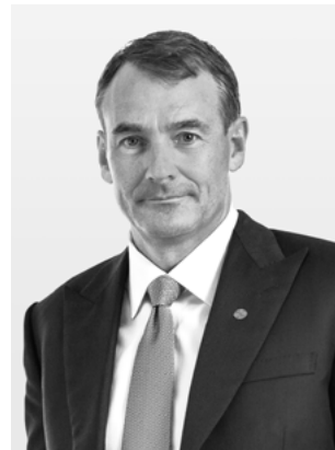
Bernard Looney Chief Executive Officer