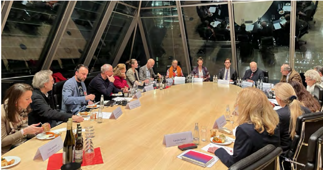
Hauptstadt-Kolloquium Integrative Medizin im November 2025 im Deutschen Bundestag

Zukünftig soll das Hauptstadt-Kolloquium Integrative Medizin als regelmäßiges politisch-wissenschaftliches Forum im vorparlamentarischen Raum etabliert werden. Es bietet im informellen Setting Gelegenheit für eine interaktive Bestandsaufnahme und einen Austausch über wissenschaftliche Erkenntnisse, klinische Praxis und internationale Erfahrungen. Unter diesen Vorzeichen bringt das Kolloquium politische Entscheidungsträger sowie Akteure aus Politik, Medizin, Versorgung, Wissenschaft, Patientenvertretung und Zivilgesellschaft mit Vertretungen und Praktikern der integrativen Heilverfahren zusammen.