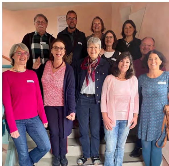
Teilnehmende des Präsenztreffens im Oktober 2025 in Kassel

LIMed wächst, gewinnt Einfluss und zeigt, dass integrative Medizin konstruktiv ist und einen Platz in der ärztlichen Selbstverwaltung hat.