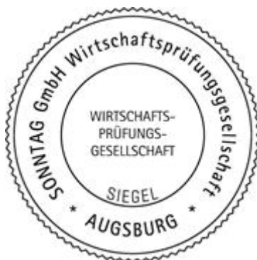
ppa. Betzmeir Wirtschaftsprüferin

Eine Verwendung des Bestätigungsvermerks außerhalb dieses Dokuments bedarf unserer vorherigen Zustimmung. Bei Veröffentlichungen oder Wiedergabe des Jahresabschlusses und/oder Lageberichts, der Lokomotion Gesellschaft für Schienentraktion mbH, München , in einer von der bestätigten Fassung abweichenden Form (einschließlich der Übersetzung in andere Sprachen) bedarf es zuvor unserer erneuten Stellungnahme, sofern hierbei unser Bestätigungsvermerk zitiert oder auf unsere Prüfung hingewiesen wird; auf § 328 HGB wird verwiesen. Bei der Printversion des Dokuments handelt es sich um eine Kopie des digitalen Originals.