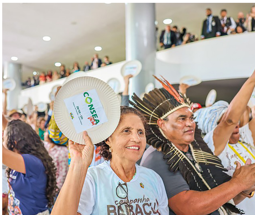
Soziale Teilhabe ist Kern des brasilianischen Rats für Ernährungssicherheit.