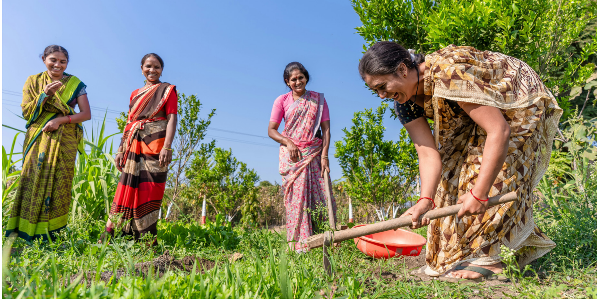
Indische Bäuerinnen in Andhra Pradesh