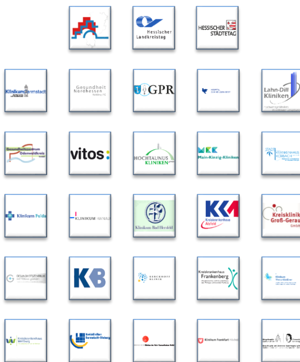
Abbildung 1: Klinikstandorte und Mitgliedsunternehmen im Klinikverbund Hessen e. V.