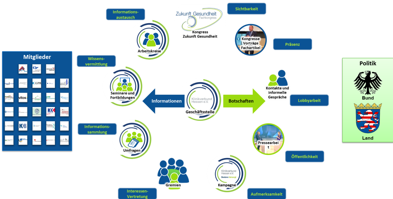
Abbildung 2: Konzept und Tätigkeitsfelder des Klinikverbunds Hessen