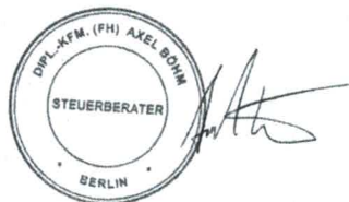
Axel Böhm Steuerberater