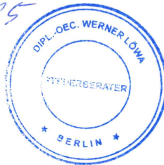
Werner Löwa Steuerberater