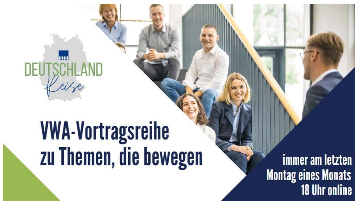
Abbildung 3: Werbematerial für die neu konzipierte VWA-Deutschlandreise

Mit dieser brandneuen Veranstaltungsreihe, die im digitalen Format im monatlichen Rhythmus kostenfrei übertragen wird, können sich Bildungsinteressierte, Studierende, Arbeitgeber und kooperierende Unternehmen auf dem Laufenden halten. Die Vortragsreihe finden immer am letzten Montag des Monats statt. Insgesamt wird das Programm sehr gut angenommen und die Teilnehmerzahlen steigen stetig an.