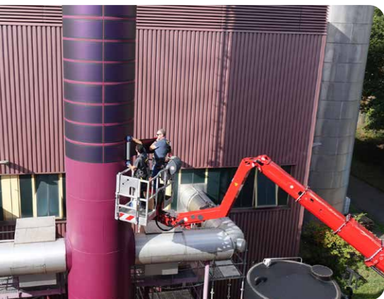
PV-Folien am Schornstein produzieren Solarstrom.

Dieser Weg ist ein fortlaufender Prozess, in den alle Unternehmensbereiche eingebunden sind. Die Bandbreite reicht von millionenschweren Investitionen in die Energieinfrastruktur über Lärmschutz bis zu Maßnahmen, die den Arbeitsalltag nachhaltiger gestalten. Dazu zählen u.a. ein verantwortungsbewusster Umgang mit Ressourcen und die Digitalisierung von Prozessen, z.B. im Personalbereich. Den Grundstein für seine Nachhaltigkeitsbestrebungen hat der Flughafen vor mehr als 10 Jahren mit seiner Klimaschutzstrategie gelegt. Demnach soll der Vorfeldbetrieb bis 2035 vollständig auf regenerative Antriebe umgestellt sein, spätestens 2045 will der Airport „Net Zero Emissionen“ erreichen. Das bedeutet, dass der Flughafen eine ausgeglichene Emissionsbilanz erreicht, indem er den CO 2 e-Ausstoß so weit wie möglich reduziert und anschließend die unvermeidbaren Emissionen durch Kompensationsmaßnahmen ausgleicht.