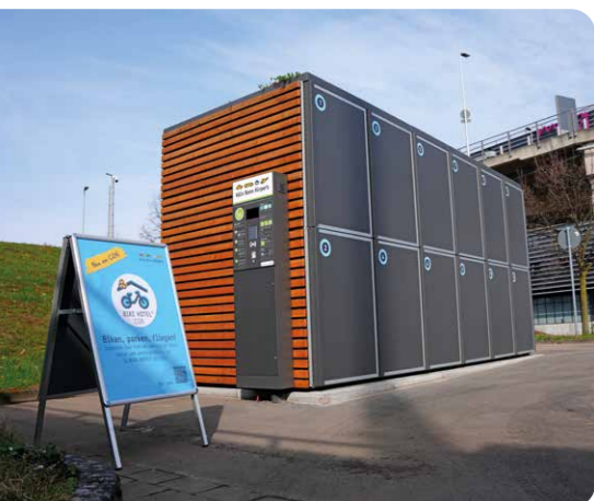
Im Bike-Hotel können Reisende hochwertige Fahrräder einschließen.

Um die Weiterentwicklung emissionsarmer Infrastruktur und den Einsatz erneuerbarer Energien voranzutreiben, hat der Flughafen ein Maßnahmenpaket geschnürt, das bis 2028 Investitionen in Höhe von 33,25 Mio. Euro vorsieht. Dafür erhält er die Rekordfördersumme von 9,75 Mio. Euro von der Europäischen Exekutivagentur für Klima, Infrastruktur und Umwelt. Zu den Maßnahmen gehört der land- und luftseitige Ausbau der Ladeinfrastruktur. Außerdem