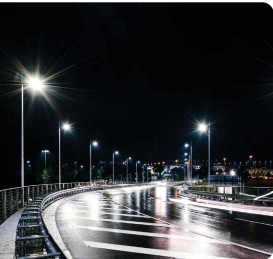
Die Beleuchtung der Straßen wird auf LED umgestellt.

Nachhaltigkeit ist eines der bestimmenden Themen unserer Zeit. Der Flughafen ist sich seiner Verantwortung bewusst und gestaltet im Spannungsfeld zwischen wirtschaftlichen Herausforderungen, ökologischen Auswirkungen und den Bedürfnissen von Nachbarschaft, Gesellschaft, Geschäftspartnern und anderen Stakeholdern seinen Weg hin zu einem nachhaltigeren Flughafenbetrieb.