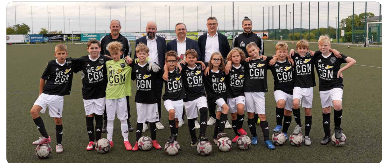
Zum Firmenjubiläum stattete der Airport 75 Kinder- und Jugendmannschaften mit Trikots aus.

investiert der Airport u. a. in Anlagen für die Klimatisierung von Flugzeugen an den Terminals und weitere elektrische Bodenstromaggregate. Pro Jahr werden so rund 6.000 t CO 2 e eingespart.