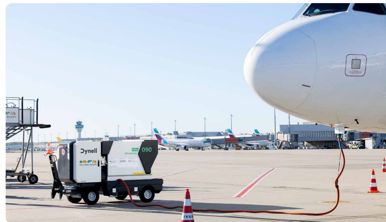
Ein elektrisches Bodenstromgerät.

Die Solaranlagen werden kontinuierlich weiter ausgebaut, für 2025 und 2026 sind ein Investitionsvolumen von 2,5 Mio. EUR vorgesehen. Der Flughafen hat Anfang 2025 rund 1.700 neue Solarmodule montiert. Sie liefern zusammen ca. 725.000 kWh regenerativen Strom, damit können fast 150 Einfamilienhäuser ein Jahr lang mit Strom versorgt werden. Zudem wurden im September 2025 im Rahmen eines Pilotprojektes Solarfolien am Schornstein des Blockheizkraftwerkes angebracht. Die Folien mit einer Gesamtgröße von rund 70 m 2 erzeugen bis zu 4.400 kWh Strom pro Jahr, decken also in etwa den Energiebedarf eines Haushalts. Im 4. Quartal 2025 wurde eine knapp 30 kWp große Solaranlage mit 68 PV-Modulen an der Warenkontrolle in Betrieb genommen. Es ist die erste Anlage auf dem Flughafen-Campus mit einem Speicher, sodass die Elektrostapler nachts mit Solarstrom geladen werden können. Auf dem Mitarbeitendenparkhaus, das auf P5 entsteht, ist ebenfalls eine neue PV-Anlage geplant. Für eine energieeffiziente Beleuchtung werden auf den Betriebsflächen und in den Gebäuden herkömmliche Leuchtmittel durch sparsame, langlebige LED ersetzt. Auch der Austausch von LED älterer Generation durch modernste Modelle bietet Einsparpotentiale. Seit 2024 ist zum Beispiel die Beleuchtung in Parkhaus 3 ausgetauscht worden. Durch die neuen Leuchten, die verkehrsabhängig gedimmt werden, werden jährlich 954 MWh Strom und etwa 370 t CO 2 eingespart.