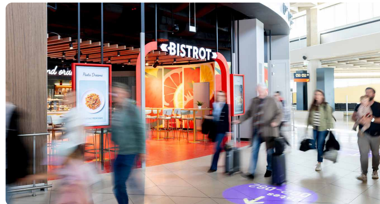
Eins der neuen Gastronomie-Angebote.

Im Segment Parken setzte sich die positive Entwicklung durch ein starkes Erlöswachstum fort. Der Oktober 2025 stellte mit Parkerlösen von über 5 Mio. EUR einen neuen Rekordmonat dar und übertraf damit das bereits sehr starke Vorjahresergebnis. Über den gesamten Monat Oktober wiesen die Parkhäuser eine sehr hohe Auslastung auf. Insgesamt entwickelte sich das Parkwachstum deutlich dynamischer als das Passagierwachstum. Auch im Bereich nachhaltige Mobilität wurden weitere Fortschritte erzielt. Durch den Ausbau der Ladeinfrastruktur für Elektromobilität wurden in den Parkhäusern 2 und 3 zusätzliche AC-Ladepunkte erfolgreich in Betrieb genommen. Die Ladeinfrastruktur wird künftig im Eigenbetrieb geführt und leistet einen wichtigen Beitrag zur Stärkung nachhaltiger Mobilitätsangebote am Campus. Die Ausschreibung der Tankstelle wurde erfolgreich abgeschlossen. Die Echo Tankstellen GmbH führt den Standort seit Anfang November 2025 unter der Marke Esso und modernisierte diesen im Rahmen eines Vertrags mit einer Laufzeit von zehn Jahren. Die Baumaßnahme für das Mitarbeiterparkhaus auf dem P5 wurde planmäßig fortgeführt. Die Fertigstellung des Projekts ist für das Jahr 2027 vorgesehen.