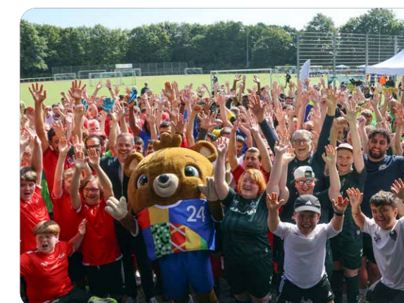
Der Airport unterstützt die Inklusionsmannschaft des FC Germania Zündorf.

Informationen zur Nachhaltigkeit finden Sie auf www.cgn-nebenan.de