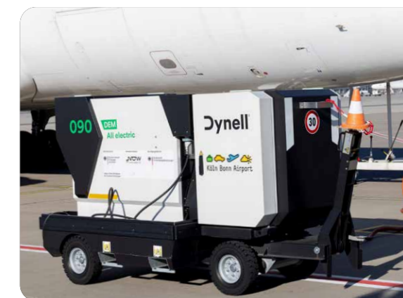
In der Abfertigung werden elektrische Bodenstromaggregate eingesetzt.

Darüber hinaus gibt es am Airport innovative Pilotprojekte, die neue Möglichkeiten der CO 2 e-Reduktion aufzeigen. So wurden 2025 erstmals Solarfolien an einem Schornstein angebracht, die bis zu 4.400 kWh Strom pro Jahr erzeugen. Sie benötigen anders als klassische Photovoltaik-Module keine Unterkonstruktion und können deshalb an Dächern, Fassaden und auf Flächen eingesetzt werden, die aufgrund von Statik und Beschaffenheit keine herkömmlichen Lösungen zulassen. Das erste Bike Hotel@ CGN bietet Pendler:innen und Reisenden die Möglichkeit, ihr Fahrrad terminalnah einzuschließen. Das Angebot fördert eine neue Form der Intermodalität, indem es die Anreise mit dem Fahrrad zum Flugzeug oder zum Zug attraktiver gestaltet. Vorfeldseitig testet der Airport mit der Deutz AG die Umrüstung von Diesel-Gepäckschleppern auf Elektroantrieb.